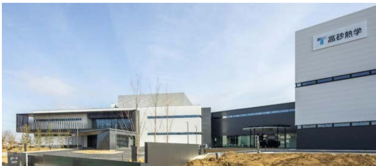
高砂熱学イノベーションセンター 外観図

高砂熱学イノベーションセンターは、建物全体に太陽光発電と蓄電池システム、バイオマス発電等、最先端の独自空調システムを駆使した省エネソリューションを施しています。アクセルは、同ソリューションの一環であるブロックチェーン技術を使ったポイントサービス「高砂エコポイントシステム」の開発協力を行いました。